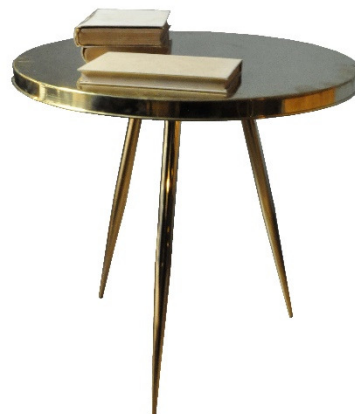
Ishtar (small table). Designed by Claudia Frignani per NB Milano