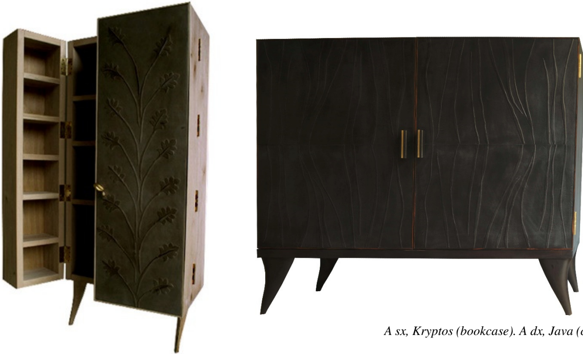
A sx, Kryptos (bookcase). A dx, Java (cabinet)

Le materie sono poi state trattate naturalmente, come le parti in legno finite con olio di lino ed essenze vegetali profumate, le pelli pieno fiore lavorate a mano con motivi in basso rilievo e lasciate al naturale o tinte e lucidate a cera d'api, le imbottiture che profumano di campo in crine vegetale, fibra di cocco e juta, le maniglie in corno nero e bianco, i metalli come il bronzo e l'ottone in lastra o in fusione, satinati, ossidati e finiti a cera.