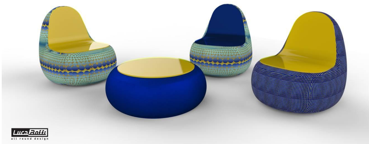
DEMI_Manuela Bucci con tessuti Sensitive® Fabrics by Eurojersey