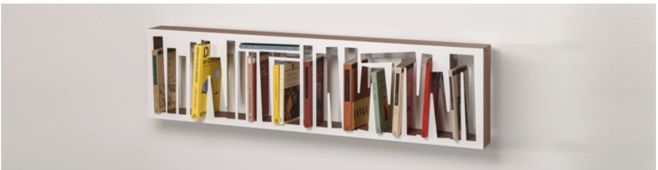
Bookshape - design Davide Radaelli, 2015

La versione modulo da parete arreda lo spazio in verticale e in orizzontale, custodendo i nostri libri del cuore.