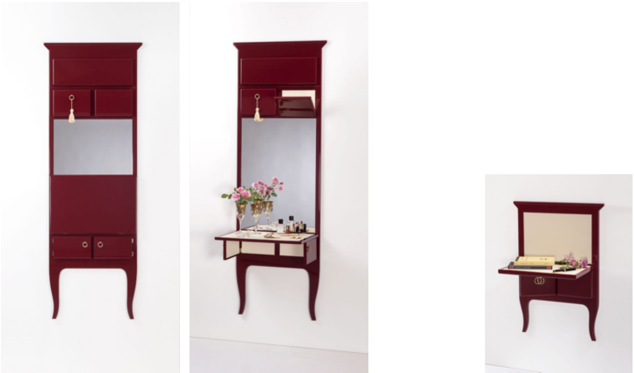
False Credenze - design HABITS Studio, 2015

La nuova versione di False Credenze nelle varianti scrittoio , comodini e consolle sempre flat e sospese a parete, assolve alla necessità di ottimizzare lo spazio qualunque sia l'ambiente della casa o angolo della stanza in cui è inserita. Ripiani e mensole soddisfano esigenze estetiche e funzionali, offrendo spazio aggiuntivo quando necessario.