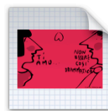
non essere drammatica.ai