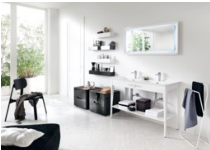
INDA: SOFT CONSOLLE

L'esposizione sarà ospitata presso l' Hotel Nhow, in via Tortona 35 a Milano, dall' 8 al 13 Aprile, dalle 10 alle 21. Inoltre, il giorno 7 aprile dalle 15 alle 20 ci sarà la preview dedicata alla stampa. Negli stessi giorni Samo Industries sarà presente al Salone Internazionale del bagno in una grande area espositiva con le importanti novità dei marchi Samo ed Inda (pad.22 C33-C37 / D32-D36).